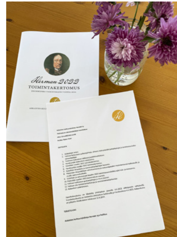
Askaisten kulttuuriyhdistys Hermanin ensimmäinen vuosikokous 22.2.2023 Pakanpirtillä.

Hermanin alkuvuoden 2023 toiminnasta on kerrottu ensimmäisen toimintavuoden toimintakertomuksessa. Tästä eteenpäin toimintakertomus kattaa aina kalenterivuoden.