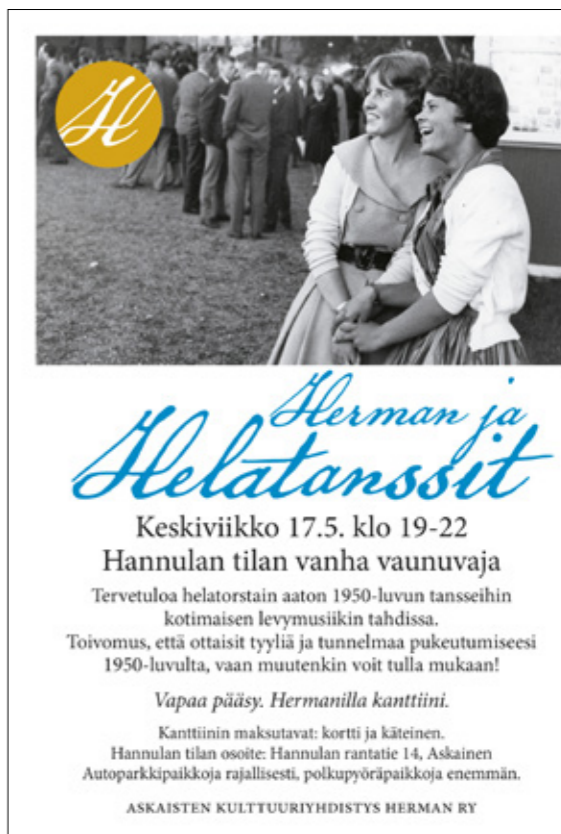
Kylmänkolea helatorstain aaton sää ei ollut suotuisin keväisille ulkoilmatansseille.

Hermanin yhteistyökumppaneita olivat vuoden aikana Louhisaaren kartanolinna/Suomen kansallismuseo, Maskun kunta, Maskun seurakunta, Naantalain museo, Svenska litteratursällskapet i Finland ja Askaisten kyläyhdistys.