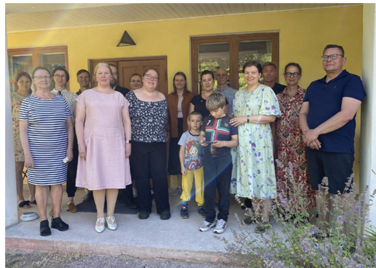
Herman-päivien luennoitsijoita, yhteistyökumppaneita ja hermanilaisia 21.7.2023 Louhisaaren kartanolinnan kesäillalla.