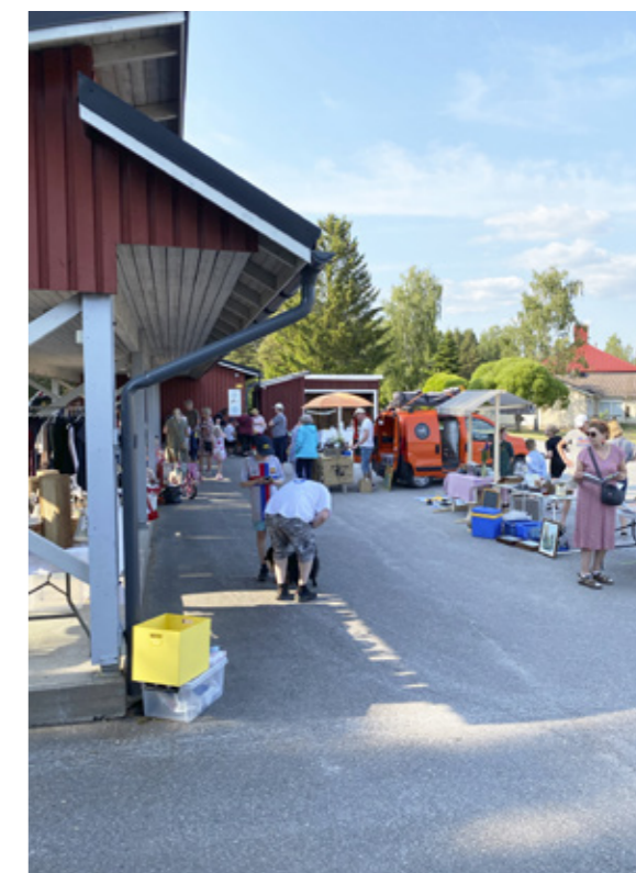
Kesäillan lämmin poutasää palkitsi iltatorilaiset.