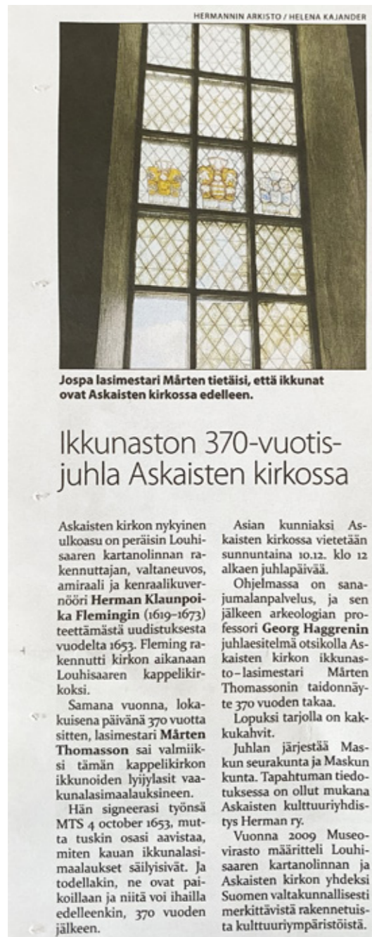
Vakka-Suomen Sanomat 7.12.2023.