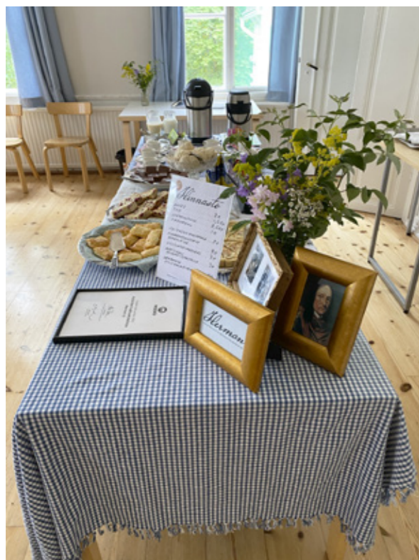
Hermanin pop-up-kahvila Mannerlahden salissa. Kaikki suolaiset ja makeat leivonnaiset olivat itse tehtyjä ja kahvi Askaisten Prännärin.

Kaikki pilottiprojektissa mukana olleet muistelijat olivat tyytyväisiä, että lähtivät mukaan projektiin. Tapaamisissa saimme myös vanhoja valokuvia tallennettavaksi Hermanin arkistoon.