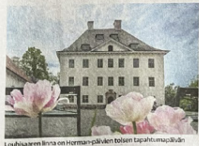
Louhisaaren linna on Herman-päivien toisen tapahtumapäivän päänäyttämö.

→ Maskuun kutsutaan työpajan ilmoittautumiset askainenherman@gmail.com. Louhisaaren leirikeskus museon 90220pääsyneku.